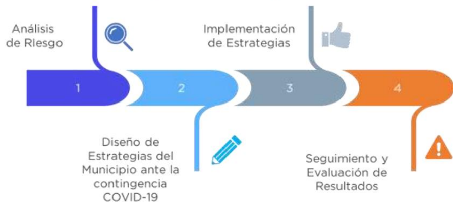
Figura 1. Plan de Trabajo